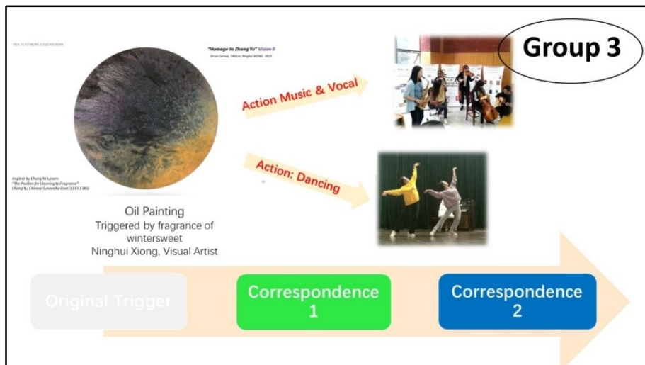
Figure 5, Group 3: create different arts triggered by the oil painting of Ninghui Xiong