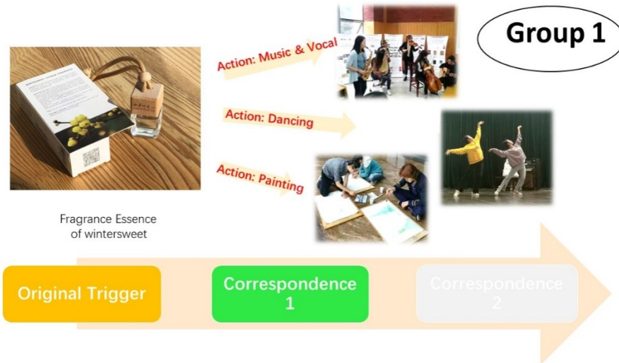
Figure 3, Group 1: create different arts triggered by fragrance essence of wintersweet

diseño. Se les asignaron tareas de ejercicio según los tres paneles de trabajo (Figura 3, 4 y 5). Esto es lo que vamos a poner en práctica en el taller.